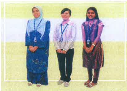
Etika Berpakaian Pelajar Perempuan UNISEL